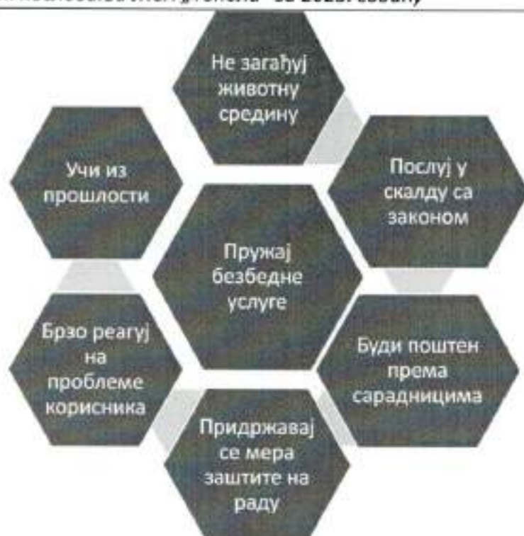
Слика 2: Основа доброг корпоративног управљања