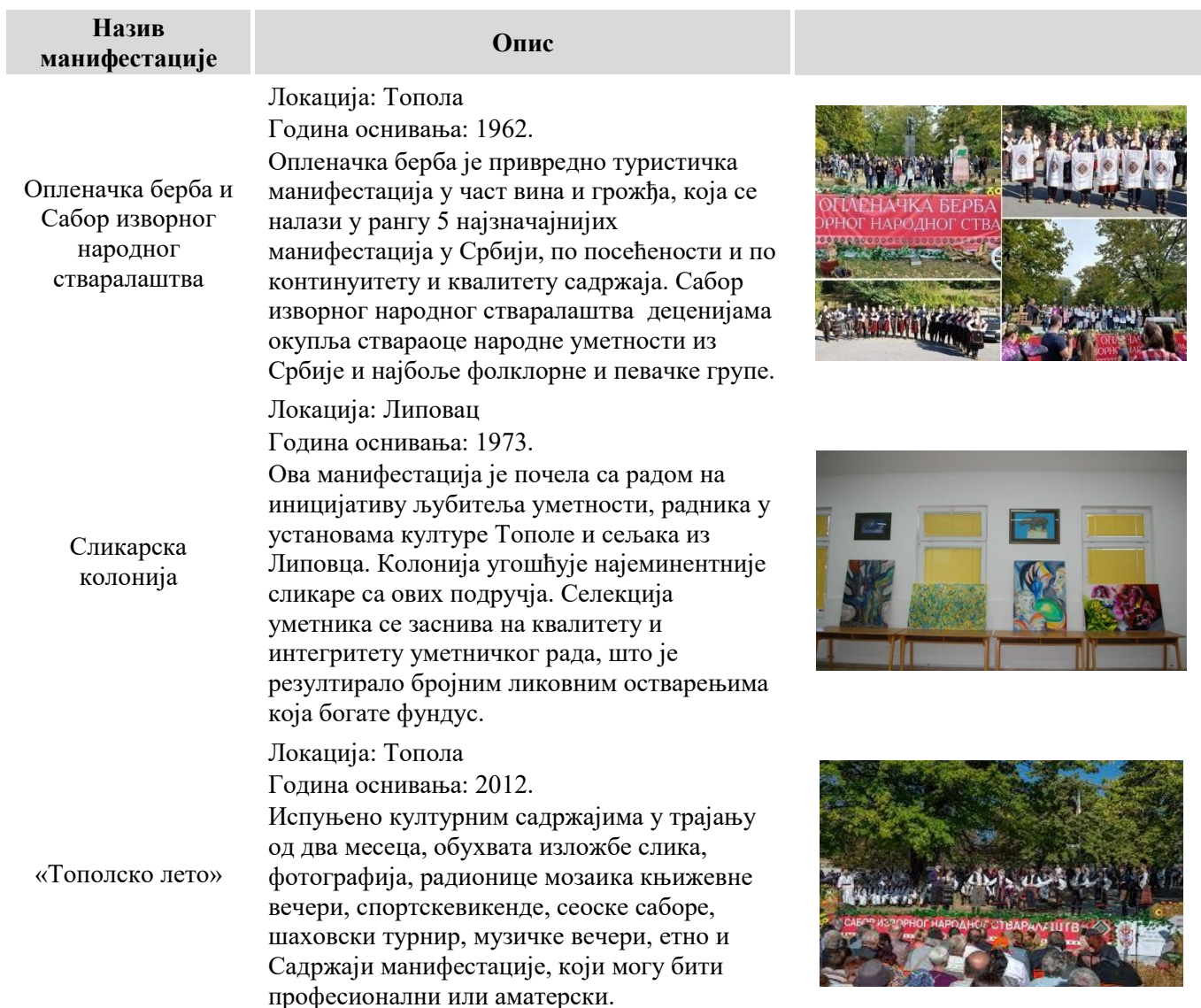
Табела 12. Туристичке и културне манифестације општине Топола

Велики проблем за развој манифестационог туризма такође представља недостатак смештајних капацитета током манифестација.