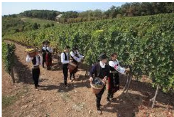
Слика 4: Берба грожђа